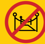
Espectacles gratuïts i actes protocolaris